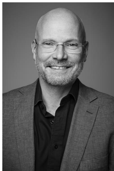
Ingmar Bergman, Oystein Wiik und Gisle Kverndokk